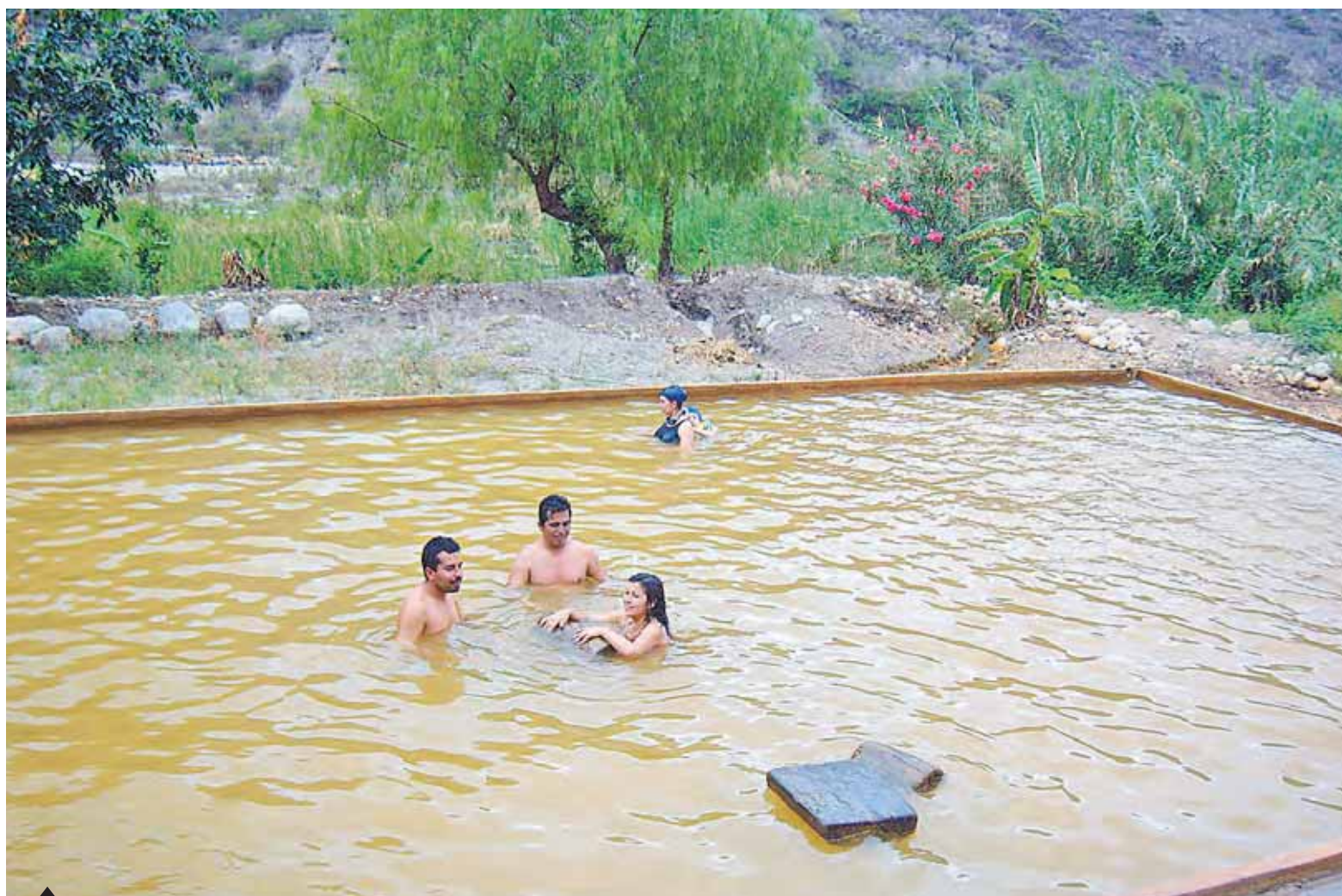
Medicinal. Baños termales de Llanguad son ricos en minerales; por eso figuran entre los principales atractivos turísticos de Celendín.