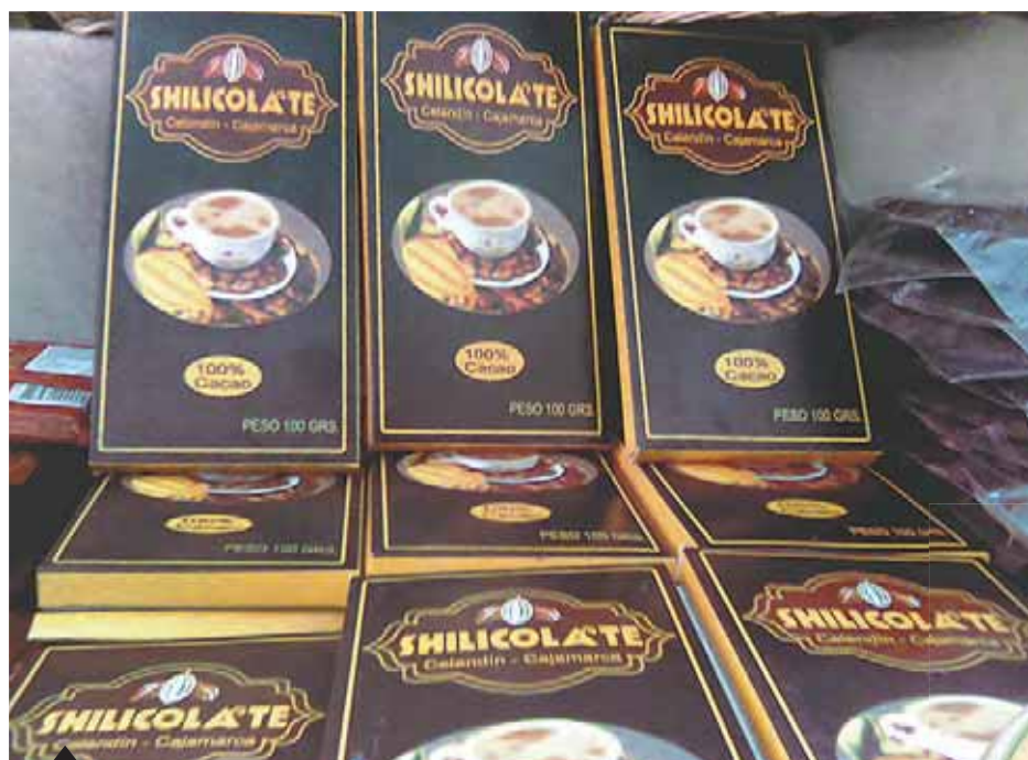
Gustos. El novedoso shilicolate sirve de fondo al insustituible cuy con papa picante.

solo 30 minutos del centro de Celendín, donde se encuentra el Cerro de Jeligi, el segundo más impresionante mirador del lugar. No solo eso, desde allí se puede apreciar la Serpiente de Oro, como se le conoce al río Marañón. Solo podrá verlo, porque si desea descender hasta él, le tomará una hora de camino aproximadamente. Si decide hacerlo, le sugerimos tomar un tour con gente que conozca la zona. El costo es de 20 soles.