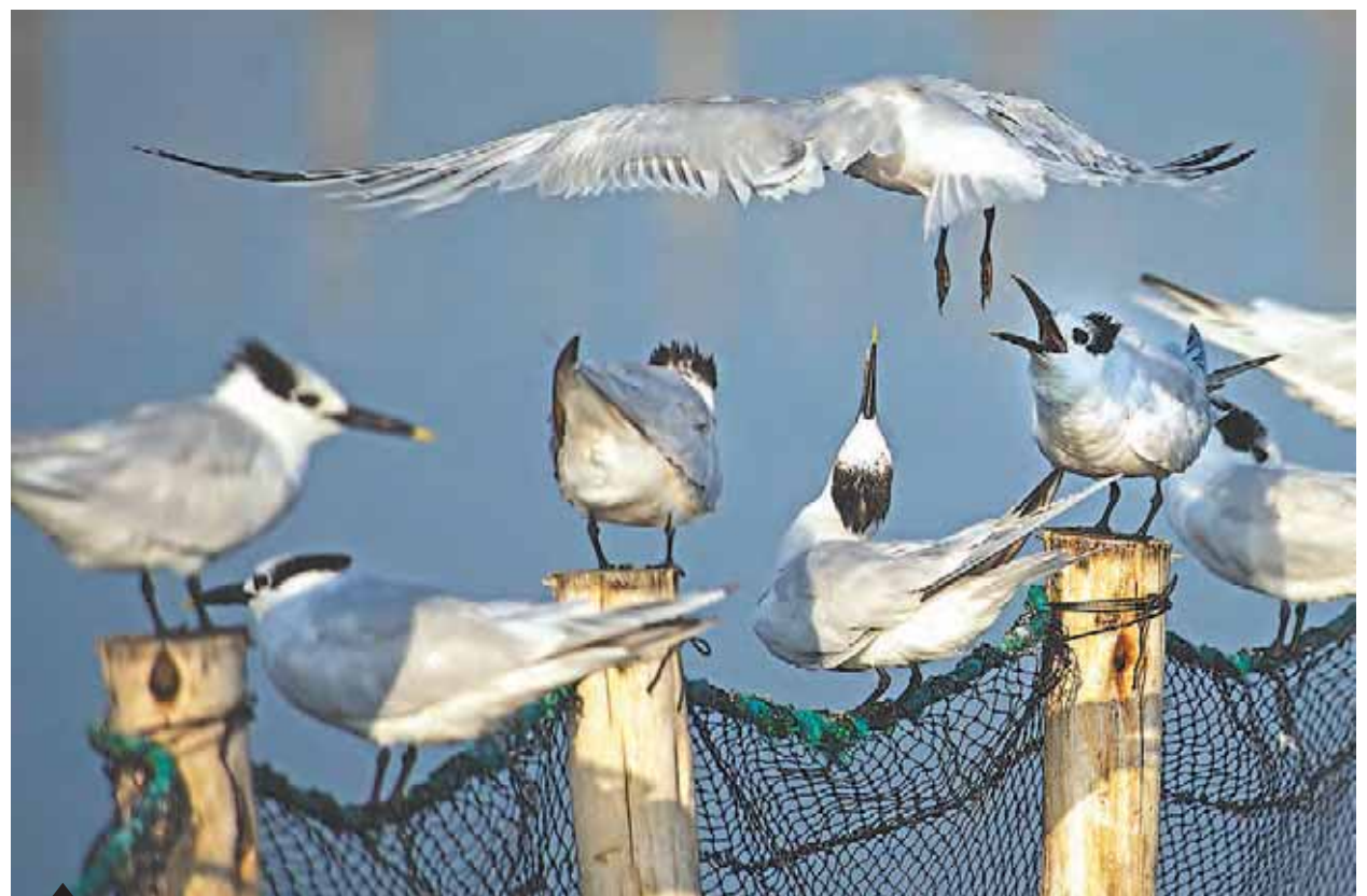
Vida en movimiento. Distintos géneros de aves emprenden cada año un largo vuelo hacia el Perú en busca del hábitat ideal.

Cada año, millones de viajeros alados cruzan el mundo. Siguen rutas invisibles, surfeando entre corrientes de aire y puntos en el horizonte. Viajan llevados por la memoria de sus ancestros grabada en los genes.