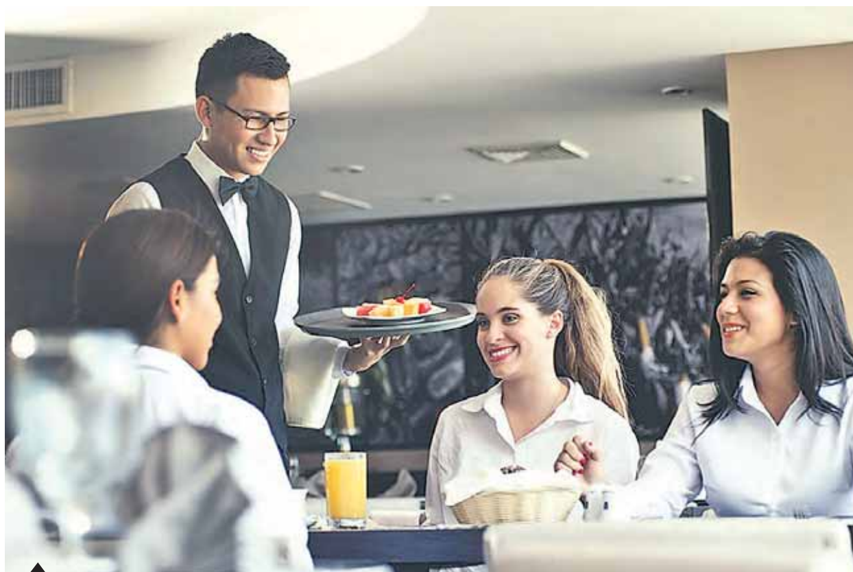
Formalidad. El Directorio de Prestadores de Servicios Turísticos ofrece información confiable para los visitantes.

Si bien las experiencias de viaje no tienen comparación por todo lo que implica conocer un destino, interactuar con las personas que tienen otras culturas y costumbres, es mejor acceder a servicios formales. Aquí, dos herramientas del Mincetur para aprovechar la estancia en el Perú.