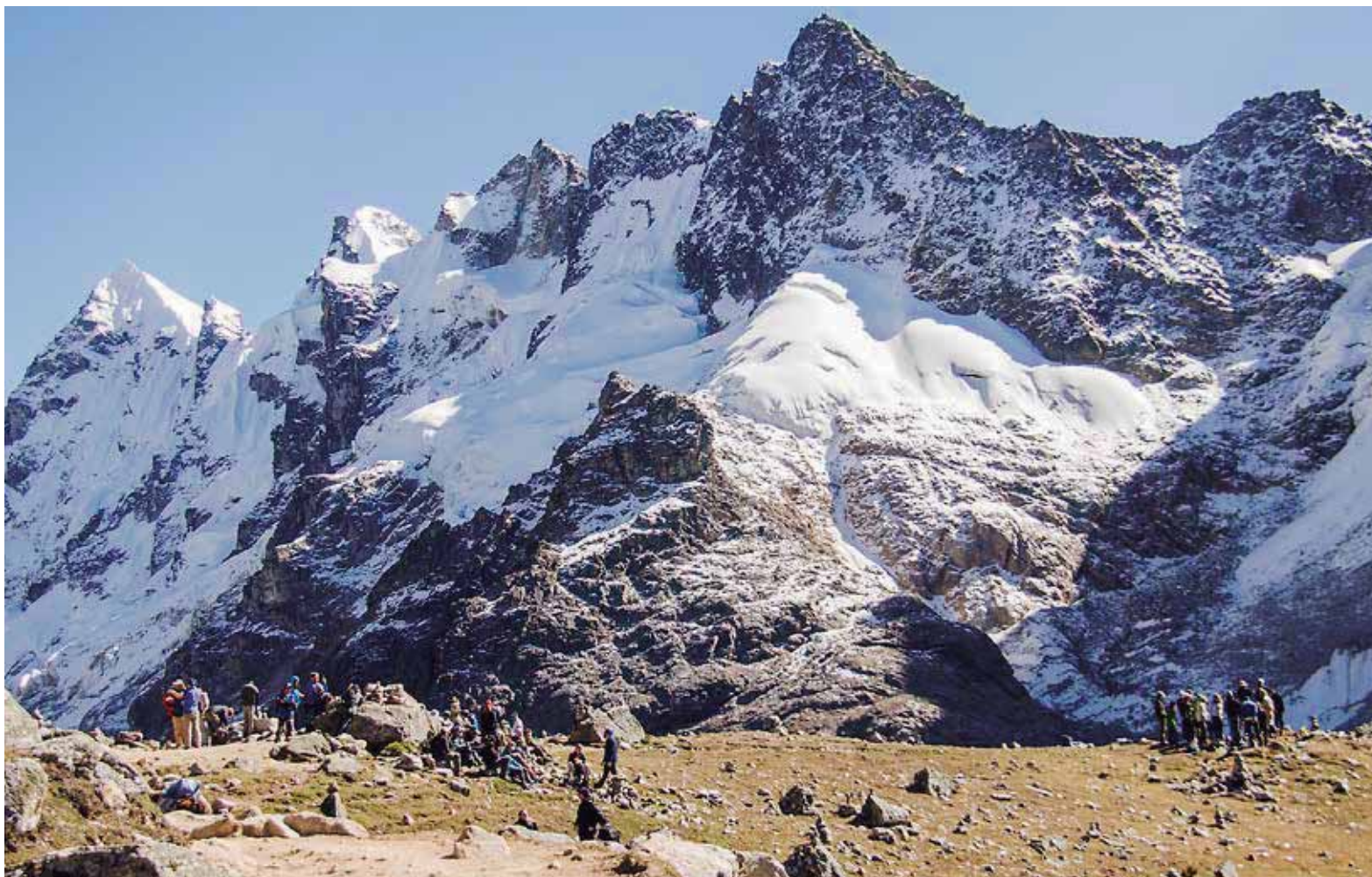
Aprendizaje. La ruta conmueve por la belleza del paisaje y motiva una reflexión en torno a la pérdida de los glaciares por el calentamiento global.

El primer día fue más liviano. Salimos de Cusco antes de que despunte el sol y pudimos cargar energías con un desayuno en Mollepata.