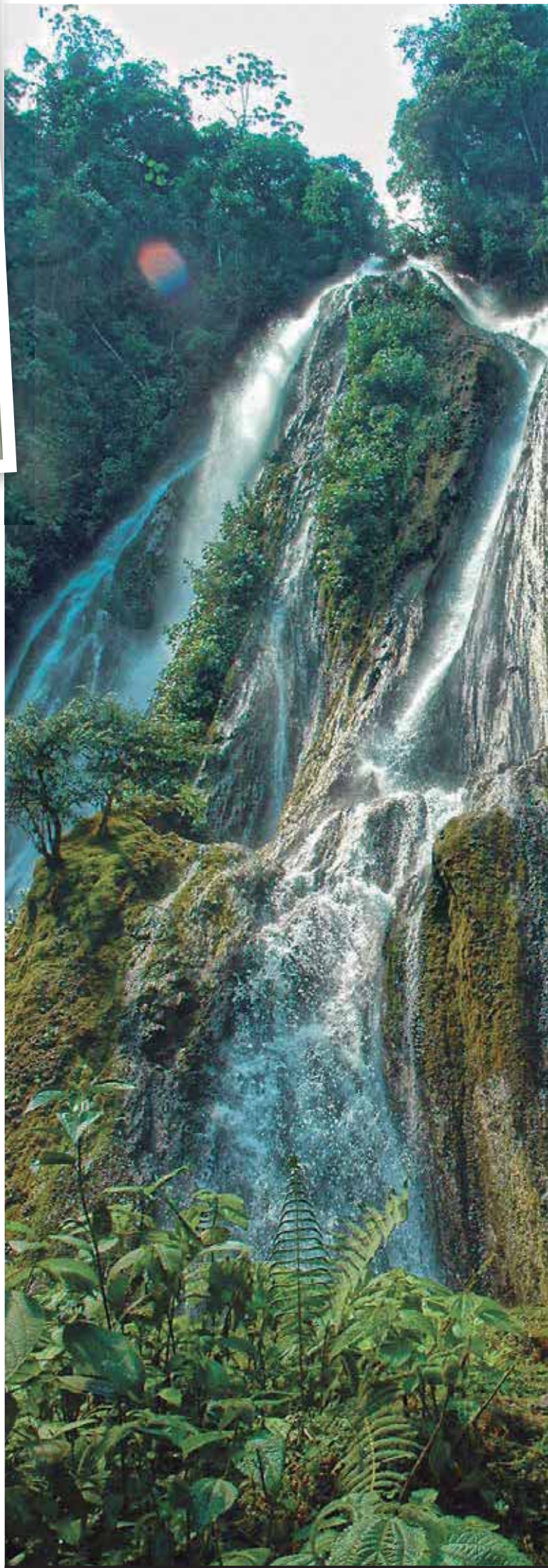
Paraíso. Los escenarios de la selva, de naturaleza desbordante y gran riqueza.

→ La mayoría de estadios opera bajo administración municipal y otros son del Instituto Peruano del Deporte.