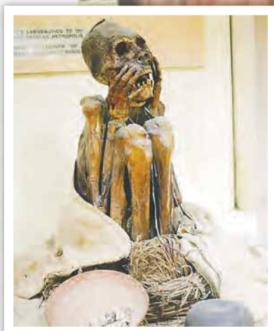
(período Paracas Cavernas) y en Warikayan (Paracas Neocrópolis).