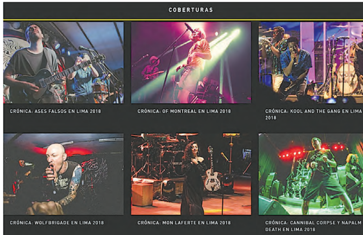
CRÓNICA: ASSES FALSOS EN LIMA 2018

Desde ese momento, no solo ellos vieron su proyecto con seriedad, algunas agencias de prensa los invitaron a eventos de sus patrocinados y, así, aumentó la lista de conciertos por disfrutar (y cubrir). En adelante, los afiches en postes y paredes se trasladaron a su flamante muro digital. Iron Maiden, Metallica, pero también los